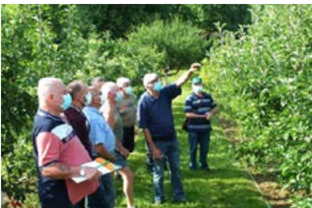
Explication du moniteur

Dans nos vergers, grâce à cette belle arrière saison ensoleillée, nos pommes se sont bien développées et ont pris une belle coloration.