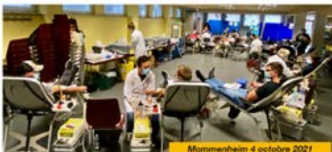
Mommenheim 4 octobre 2021

faire sous le chapiteau monté dans la cour en contrebas de l'école. La collation lors de la collecte du 4 octobre a pu se faire dans le local fraîchement rénové sous la mairie.