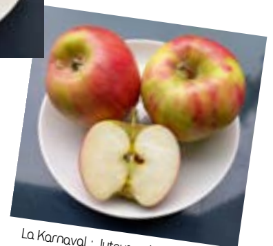
La Karnaval : Juteuse, délicieusement acidulée et agréablement parfumée, résistante aux maladies