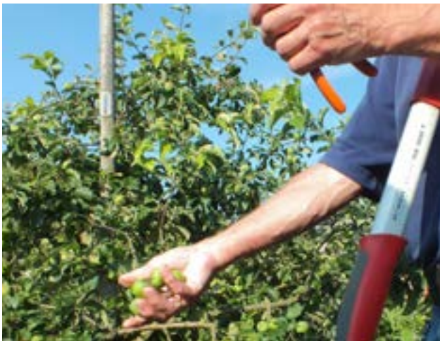
Sélection du fruit

Ainsi cet automne, nos jardins ont produit de beaux légumes (Céleris, betteraves rouges, pommes de terre, carottes et salades), les tomates plantées en plein air ont cependant connu une courte saison.