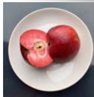
La vianda : Intérieur rouge marbré de blanc, croquante juteuse et saveur douce